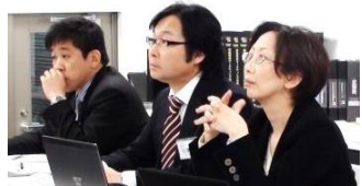
第5期MP講座 in 新潟 マーケティングアドバイザー

MP講座では「担当アドバイザー制度」を設けています。課題をどのように作成したらいいかわからない、学習方法がわからないという悩みを遠慮なく相談できるシステムとなっています。